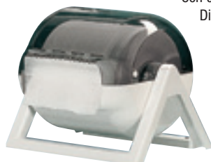
Supporto pensile in plastica per rotolo art. MP636

Supporto pensile in plastica per rotolo industriale Con carenatura - bianco / trasparente Dimen. max rotolo 280 x 260 mm. Dimen. mm 440 x 340 x 330h