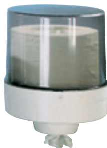
Extra ROLL-BOX art. MP552

Dimen. mm. 330, h. mm. 400 può contenere 1 rotolo Ø mm. 320 x 310 h.