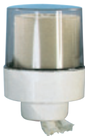
Maxi ROLL-BOX art. MP519

Dimen. Ø mm. 260, h. mm. 340 può contenere 1 rotolo Ø mm. 245 x 265 h.