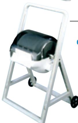
Dispenser di asciugamani art. MP638

H.A.C.C.P. Cavalletto a terra con ruote - carenato max dimensione rotolo Ø mm. 280x260h dimensioni mm. 515x470x910h