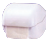
Dispenser di carta igienica art. MP618

"Duetto" bianco per rotoli o fogli. Dimensioni mm. 150x148x140h