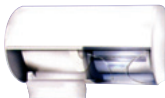
Dispenser di carta igienica art. MP755

Dispenser di carta igienica doppio orizzontale con vetrino a ritorno automatico. Colori: bianco o cromato. Capacità 2 rotoli Ø mm. 120x100h. Dimensioni 260x150x150