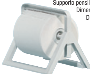
Supporto pensile in plastica per rotolo art. MP533

Supporto pensile in plastica per rotolo industriale Dimen. mm. 440 x 305 x 250 - Bianco Dimen. max rotolo 350 x 340 mm.