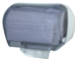
Combinotto art. MP666

Dispenser multiuso per carta asciugamani IN ROTOLO o IN FOGLI piegati a "V". Dimen. mm. 160 x 160 x 320 Bianco / trasparente Dimen. max rotolo 150 x 240 mm. Anima 40/50 mm.