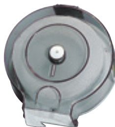
Portarotolone trasparente art. MP507

Portarotolone di carta igienica Trasparente - con posacenere Dimen. Ø mm.370 - profondità mm.130 può contenere un rotolo di Ø mm. 340