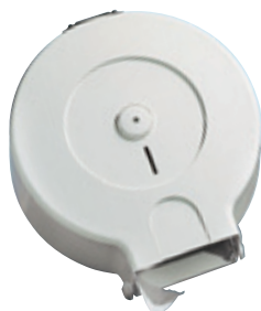
Portarotolone bianco art. MP506

Portarotolone di carta igienica Bianco - con posacenere Dimen. Ø mm.370 - profondità mm.130 può contenere un rotolo di Ø mm. 340